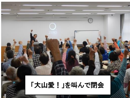
「大山愛！」を叫んで閉会

自然保護憲章制定50周年は来年2024年。全国での自然保護意識の高まりを期待しています。