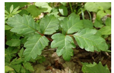
幼木の葉は縁がギザギザ

ウルシ科の植物は他にヤマウルシ・ヤマハゼ・ヌルデがあります。これらはツタウルシほどかぶれがひどくありません。