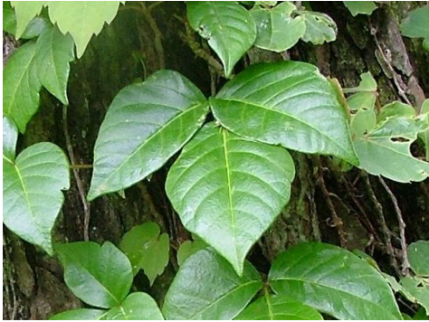
成木はつるりとした3枚の葉が特徴