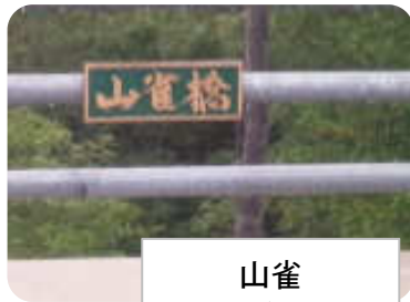
山雀 (やまがらはし)