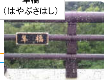
隼橋 (はやぶさはし)

大山町の山香荘付近(大山町加茂)から赤碕方面へと抜けて行くと七鳥橋ロードがあります。