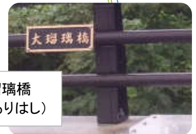
大瑠璃橋 (おおるりはし)