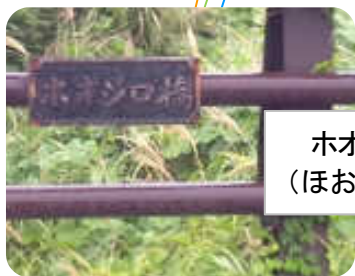
ホオジロ橋 (ほおじろはし)