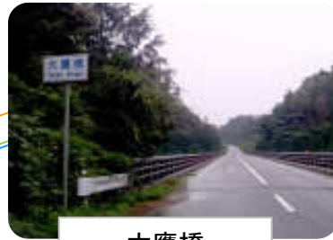
大鷹橋 (おおたかはし)