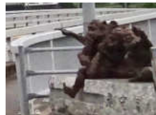
伯耆町溝口、伯耆町宇代