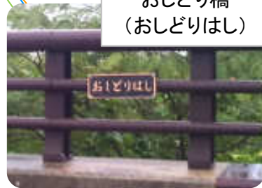
おしどり橋 (おしどりはし)