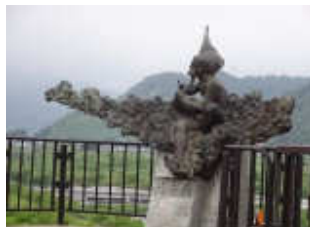
伯耆町溝口、伯耆町宇代