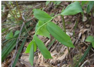
ミヤマナルコユリ キジカクシ科アマドコロ属

茎が角張って(稜があれば)いればアマドコロ。そうでないのがナルコユリ。 茎を触ってみて、ちょっとでも引っかかりがあるのがアマドコロで、ツルツルなのがナルコユリです。 ナルコユリは花の直前で二股に分かれています。アマドコロの花茎は茎に近い部分で分かれています。 近似種のホウチャクソウは枝分かれするので、見た目からも区別することができます。 特徴を覚えておけば、花の咲いていない時期でも、葉や茎を見ればわかるように。