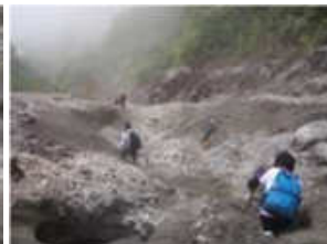
砂すべりは状態が悪く段差が多数あります。また上宝珠付近も一部崩落があります。 (7月14日午後11時から15日午後2時までの大山町大山の降雨量225.2mm)