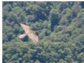
ハヤブサに出会いました。 (7月9日 矢筈ヶ山)