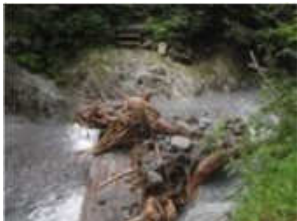
中国自然歩道(川床橋) ※7月24日現在通行止めです。