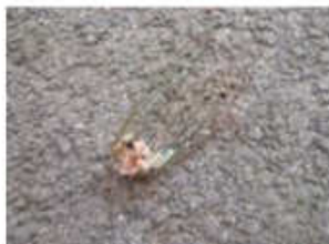
自分の何十倍もの蟬を運ぶ蟻たち。 (7月5日 大山寺地区)