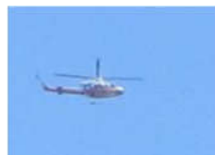
夏山登山道で救助事案発生。 体調管理(水分補給)は十分に。 (7月11日 大山)