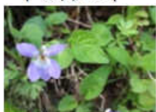
オオタチツボスミレ