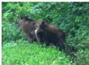
親子と思われる猪に出会いました。 (7月15日 蒜山)