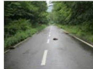
衝突事故発生。5匹の瓜坊が…。 (7月6日 大山口佐摩線)