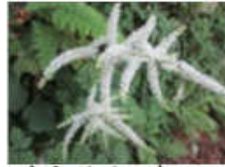
トリアシショウマ