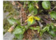
ダイセンキスミレ