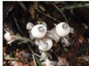
某妖怪…の正体はギンリョウソウ。 (6月24日 大山寺地区)