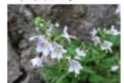
ダイセンクワガタ