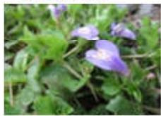
ムラサキサギゴケ