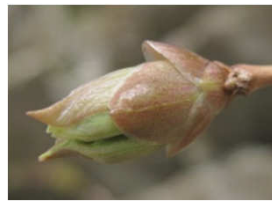
ダイセンヒョウタンホク